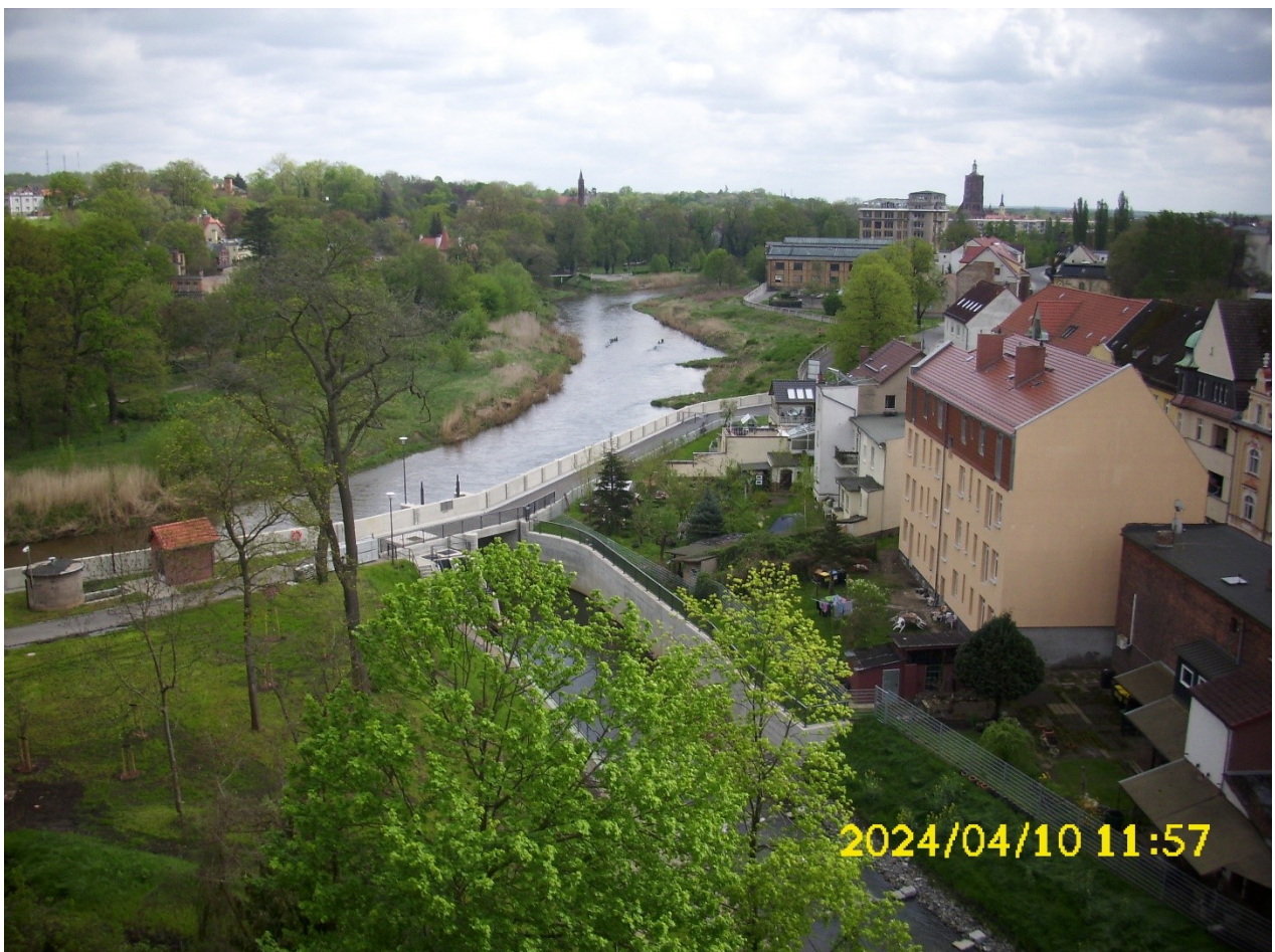
Abbildung 2 - fertiggestelltes Bauwerk