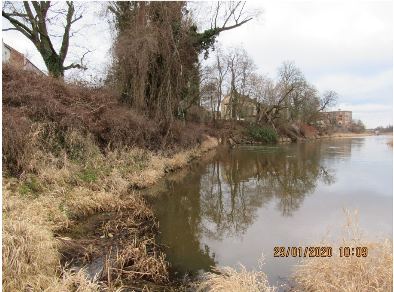
Abbildung 1 - Uferbereich Lausitzer Neiße und Auslaufbereich der Egelneiße